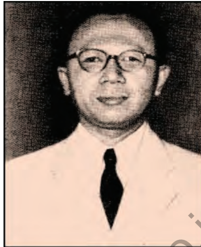
Gambar 2.3 Dr. Djuanda Kartawidjaja

Berkat pandangan visioner dalam Deklarasi Djuanda tersebut, bangsa Indonesia akhirnya memiliki tambahan wilayah seluas 2.000.000 km 2 , termasuk sumber daya alam yang dikandungnya. Sebagai Warga Negara Indonesia, kalian harus bersyukur kepada Tuhan Yang Maha Esa dan harus merasa bangga, karena negara kita merupakan negara kepulauan terbesar di dunia. Luas wilayah negara kita adalah 5.180.053 km 2 , yang terdiri atas wilayah daratan seluas 1.922.570 km 2 dan wilayah lautan seluas 3.257.483 km 2 . Di wilayah yang seluas itu, tersebar 13.466 pulau yang terbentang antara Sabang dan Merauke. Pulau-pulau tersebut bukanlah wilayah-wilayah yang terpisah, tetapi membentuk suatu kesatuan yang utuh dan bulat sebagaimana diuraikan di atas.