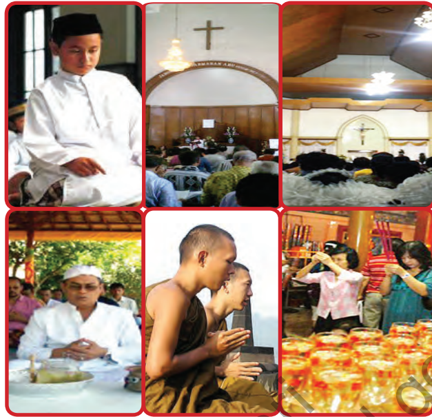
Gambar 2.8 Beberapa Aktivitas keagamaan.

Apa yang kalian pikirkan setelah melihat gambar di atas? Tentu saja kalian sudah dapat menyimpulkan bahwa setiap orang di negara Indonesia dapat melakukan berbagai macam aktifitas keagamaan sebagai wujud dari adanya kemerdekaan beragama dan kepercayaan. Apa sebenarnya kemerdekaan beragama dan berkepercayaan itu?